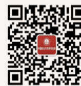
研究生院 微信公众平台