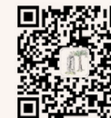
研究生迎新 微信公众平台