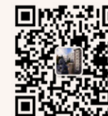
研招办 微信公众平台