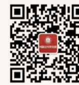
研究生院 微信公众平台