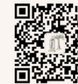
研究生迎新 微信公众平台