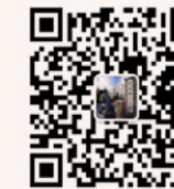
研招办 微信公众平台